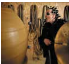
Pierre Redon, Les Sons des Confins , 2016 © Pierre Redon

À la fois documentaire, création sonore et cartographique, ce projet propose de découvrir deux parcours sur le thème de l'eau dans le Parc Naturel Régional de Millevaches. Plus d'infos : OT Felletin (05 55 66 54 60) et Accueil Touristique Faux-la-Montagne (05 55 64 47 35).