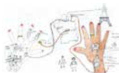
Résidents de l'EHPAD de Royère de Vassivière. Atelier de Cartographie, 2015.