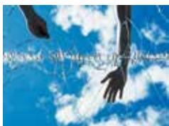
Thierry Fontaine, Skyline , 2008. Photographie couleur, 75 x 100 cm. Collection Artothèque du Limousin.