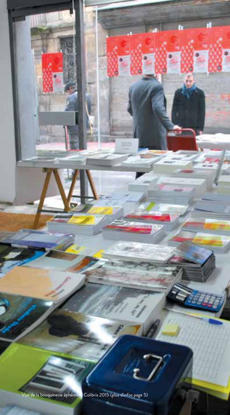
Vue de la bouquinerie éphémère Colibris 2015 (plus d'infos page 5)