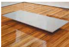
Guillaume Valenti, Porquet , 2015. Huile sur toile, 195 x 130 cm.

Cette exposition est dédiée à de jeunes diplômés d'écoles d'art : Bordeaux, Bourges, Clermont-Ferrand et Limoges. Pour les artistes retenus c'est une façon de confronter – bien souvent pour la première fois – leur travail au regard du public.