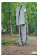
François Bouillon, Solstice d'été , 1984. Granit et noir de fumée, 400 x 100 x 100 cm. © Centre international d'art et du paysage de l'île de Vassivière. Collection Syndicat mixte Le Lac de Vassivière.

Regard sur les dernières acquisitions d'œuvres photographiques. Quelques artistes remarquables.