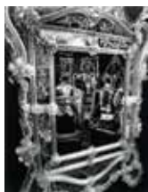
Valérie Belin, Sans titre , 1998. Photographie, 80 x 60 cm © V. Belin. Collection de l'Artothèque du Limousin.

La photographe parcourt les endroits les plus sensibles de la planète. Avec cette série, réalisée en 2002 au Cambodge, elle montre les soubresauts d'une civilisation déchirée par les conflits.