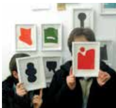
Opération Tout doit disparaître , Tulle, 2006. Œuvres de Nelly Maurel, série Pictogrammes , 2005.

Découvrez sur rendez-vous ou sur les différents lieux d'intervention, le véhicule art nOmad qui est à la fois un espace de recherche et de production, un outil d'expression et de transmission de l'art contemporain sur le territoire.