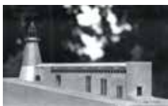
Maquette du Centre international d'art et du paysage, projet architectural d'Aldo Rossi et Xavier Fabre. Photo : Dominique Marchès.

Sabrina Chou (USA, www.sabrinachou.com ), Riccardo Giacconi (Italie, www.phdarts.eu/DoctoralStudents/RiccardoGiacconi ) et Ciaran O'Dochartaigh (Irlande du Nord, www.ciaranodochartaigh.org )