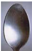
Patrick Tosani, C , 1988. Photographie cibachrome, 182 x 120 cm © P. Tosani. Collection du FRAC Limousin.

Dans le cadre de leur résidence à Treignac, Birk et Lea, artistes norvégiens basés à Copenhague, présentent leurs travaux de peinture, photo et sculpture réalisés pendant leur séjour.