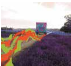
Clorinde Coranotto Le véhicule art nOmad , 2005.

Undershoot est un projet d'opéra numérique en 3 actes. S'attachant à la spécificité du lieu investi, un réseau de machines prennent la parole, de manière silencieuse mais visible.