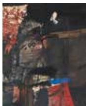
Antoni Clavé, Don Servando et l'autre, 1974. Huile et collage sur toile, 235 x 345 cm (détail).