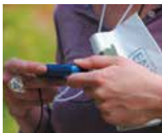
© Pierre Redon - Édmond Carrère.

La plateforme de création contemporaine présente des maquettes d'artistes et tissages tout juste "tombés du métier". L'accrochage est constamment renouvelé selon les départs d'œuvres pour des expositions et l'avancée des nouveaux tissages.