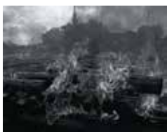
Anne-Marie Filaire, Le feu, Battambang, Cambodge , 2002. Photographie, 125 x 154 cm. Collection du FACLIM.

Restitution des ateliers autour du corps et de la cartographie menés par l'artiste Laurie-Anne Estaque et Aude Haussener avec des résidents de l'Ehpad Pierre Ferrand de Royère de Vassivière.