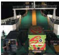
Clorinde Coranotto, Baptême salé du Véhicule art nOmad , 2015