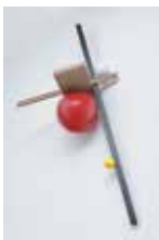
Mathieu Mercier, 3 axes / 3 sphères , 2014. MDF, plastique, caoutchouc, acier, bois, 200 x 168 x 15 cm.