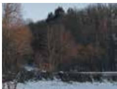
Nolwenn Brod, Aubes, les corps solidaires , 2012. Photographie, 13 x 18 cm

Son œuvre (verre, inox, eau) installée à l'entrée de la cour de la M.J.C s'inscrit dans l'importance qu'il donne à la propagation de la lumière. Commande publique du Ministère de la Culture, avec le soutien de la Fondation de France.