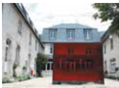
Laurent Saksik, Nuage rouge , 2007. Tirage sur aluminium, 100 x 130 cm, pièce unique. Courtesy de l'artiste. Photo : Joëlle Commencini

L'intégralité de la collection est présentée toute l'année. Plus de 80 peintures et sculptures exceptionnelles dans un écrin architectural.