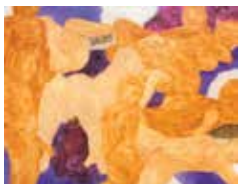
Philippe Kremer, The Gathering , 2014. Huile sur toile. © P. Kremer.

Œuvres des collections du FRAC et de l'Artothèque du Limousin. Dialogue entre deux artistes de la même génération à travers des sculptures et des œuvres sur papier.