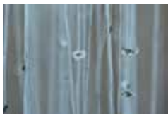
Safaa Erruas, Invisibles , 2011. Installation - métal, papier, fil.

JUSQU'AU 15 DÉCEMBRE 2016 MUSÉE DE ROCHECHOUART 2