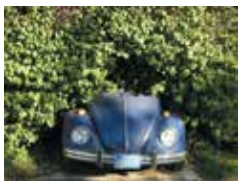
Scoli Acosta, Une coccinelle dans son environnement naturel , 2008. Impression numérique, 23,5 x 31 cm (cadre). © Scoli Acosta. Collection Artothèque du Limousin

JUSQU'AU 18 SEPTEMBRE 2016 FRAC-ARTOTHÈQUE DU LIMOUSIN À Saint-Fréjoux