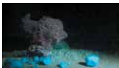
Hachim Berrada, Présage , 2014. Collection musée départemental d'art contemporain de Rochechouart.

DU 8 OCTOBRE AU 4 DÉCEMBRE 2016 MUSÉE DE ROCHECHOUART 2