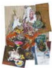
Paul Rebeyrolle, La Grande Nature Morte, 1999. 335 x 265 cm.

Découvrez en toutes saisons les œuvres temporaires ou permanentes, monumentales ou discrètes du Centre international d'art et du paysage réparties sur les 70 ha de l'île de Vassivière. Accès libre, plan en vente à la librairie, vidéoguide.